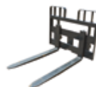
ВИЛЫ ДЛЯ ПОДДОНОВ